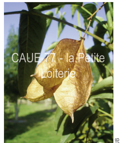
Capsules vésiculeuses à 2 ou 3 lobes

Staphylea : du grec staphulé, grappe (pour ses inflorescences) colchica : de Colchide (sud du Caucase)