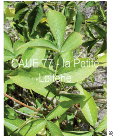
Feuille composée (10 à 18 cm)