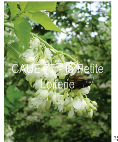
Floraison en panicules (5 à 12 cm)