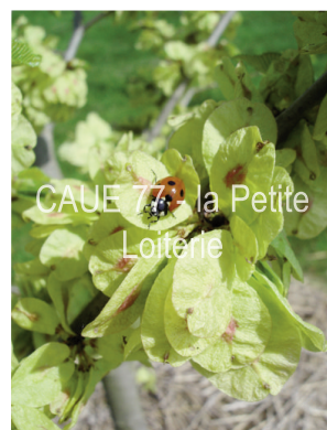
CAUE 77 - la Petite Loiterie