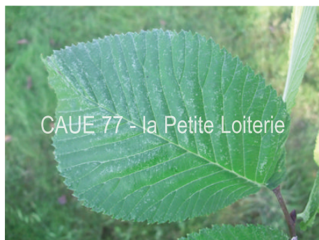
CAUE 77 - la Petite Loiterie