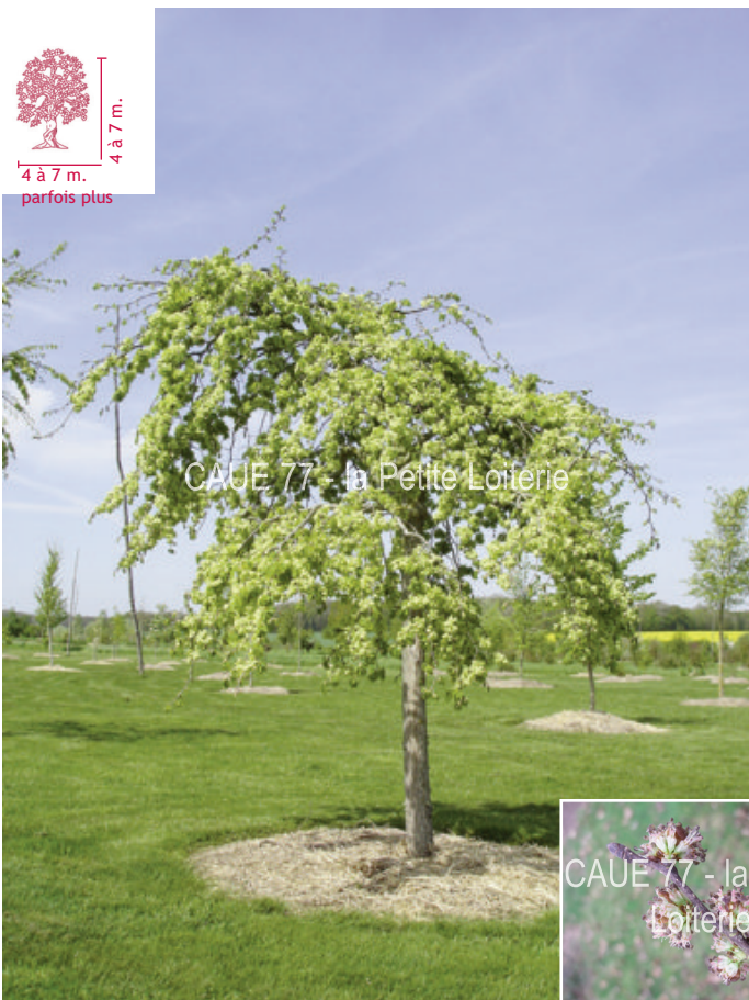
CAUE 77 - la Petite Loiterie