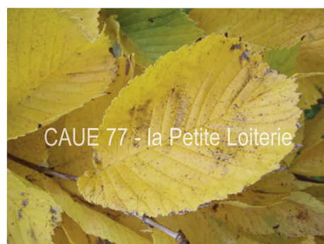
CAUE 77 - la Petite Loiterie