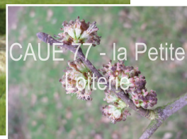
Floraison sur les rameaux

ulmus : du nom latin de cet arbre. glabra : glabre, sans poil en latin Camperdownii : création horticole obtenue à Camperdown House en Ecosse