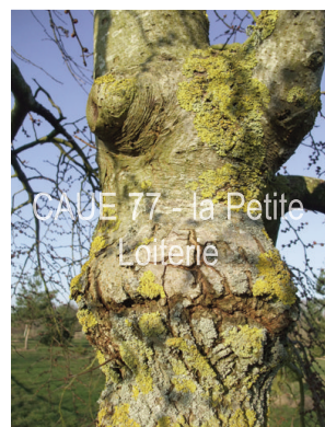
CAUE 77 - la Petite Loiterie